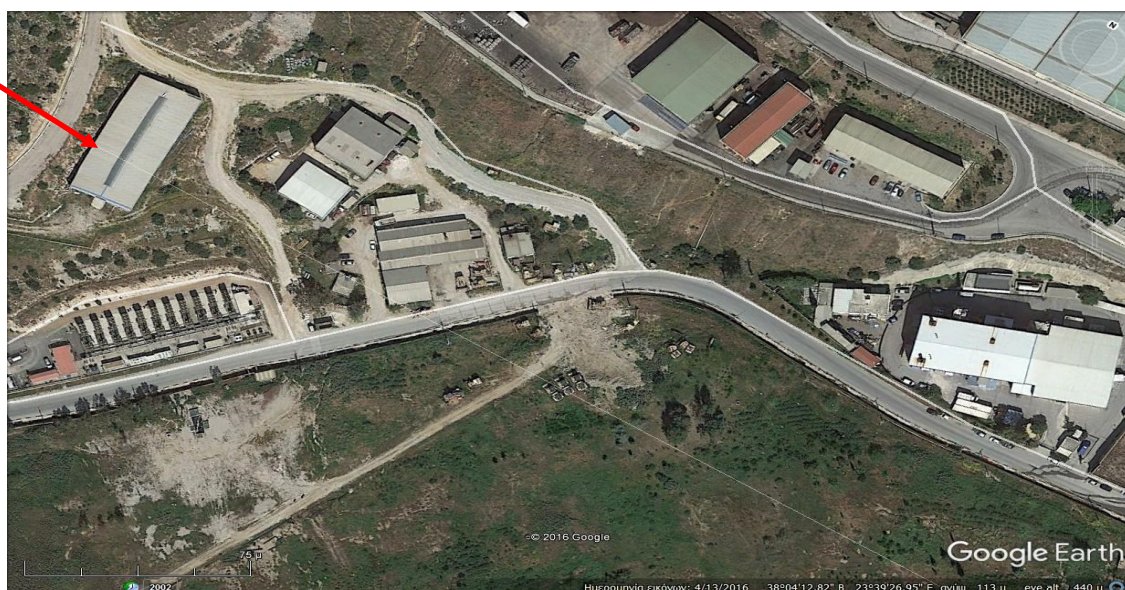
Φωτογραφία 1: Η θέση της αποθήκης (κόκκινο βέλος) σε σχέση με την θέση της Μονάδος του Αποτεφρωτήρα (μπλε βέλος).

Το σύνολο των επικινδύνων αποβλήτων εντοπίζεται σε αποθήκη εγγύς της Μονάδος του Αποτεφρωτήρα και εντός της Ο.Ε.Δ.Α. Δυτικής Αττικής ( συνημμένο 1 ).